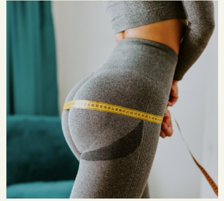
Online diyet+online egzersiz programı danışmanlığı